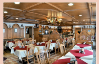
Frühstücksraum im Hotel

Saunaparadies (direkter Zugang vom Appartement-Hotel) · Soledampfbad 40 - 45°C · Softsauna (Biosauna) 50°C · Finnische Sauna 80 - 90°C · Infrarotkabine 42 - 45°C · Ruheraum mit Wasserbetten · Wärmeliegen · Frischluftbereich · Erlebnisduschen mit Eis- und Tropenregen